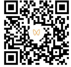
扫描二维码观看完整案例视频 (含视频号链接)

这种方法让未来的运营团队能够实时了解空间功能，帮助他们在设备安装前发现潜在的障碍或设计缺陷，从而避免后期昂贵的改动，确保服务从第一天起就顺畅运行。