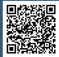
扫描二维码获取案例详情